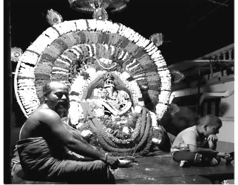
விநாயகர் சதுர்த்தியன்று ஊர்வலம்