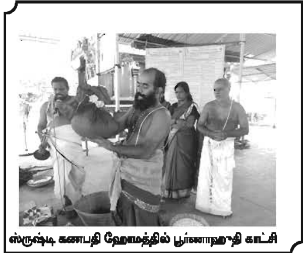
ஸ்ருஷ்டி கணபதி ஹோமத்தில் பூர்ணாஹுதி காட்சி

இலவச மருத்துவமனை பொருளாகவோ, மருந்துகளாகவோ நன் கொடை அளித்து நோயற்ற வாழ்வு பெறுங்கள்!